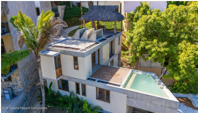
MIS Vallarta Nayarit Compostela