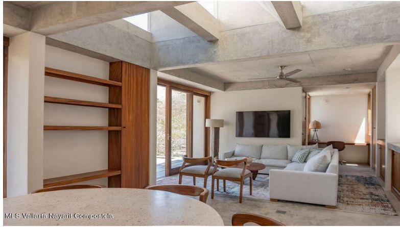
MIS Vallarta Nayarit Compostela