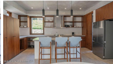
MIS Vallarta Nayarit Compostela