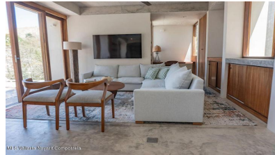
MIS Vallarta Nayarit Compostela