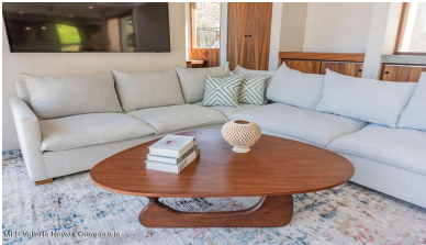
MIS Vallarta Nayarit Compostela