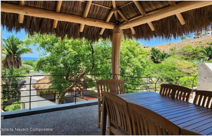
MIS Vallarta Nayarit Compostela