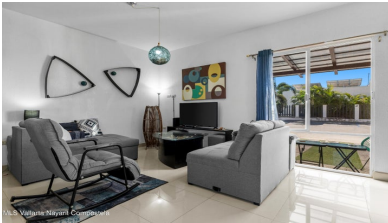
MLS Vallarta Navarri Compostela