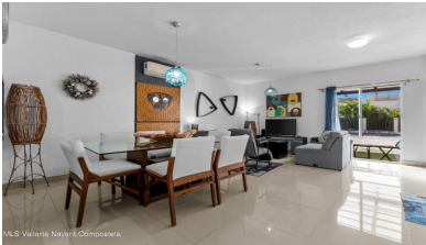
MLS Vallarta Navarri Compostela