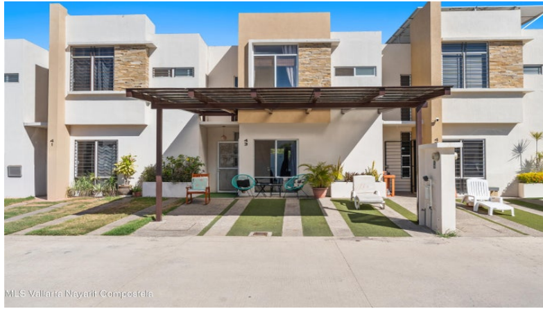
MLS Vallarta Navarri Compostela