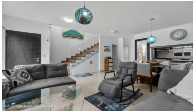
MLS Vallarta Navarri Compostela