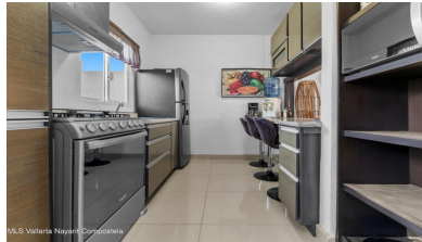
MLS Vallarta Navarri Compostela