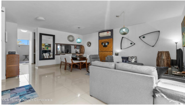
MLS Vallarta Navarri Compostela