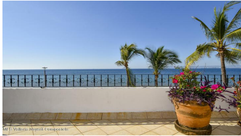
MI S Vallarta Nayarit Compostela