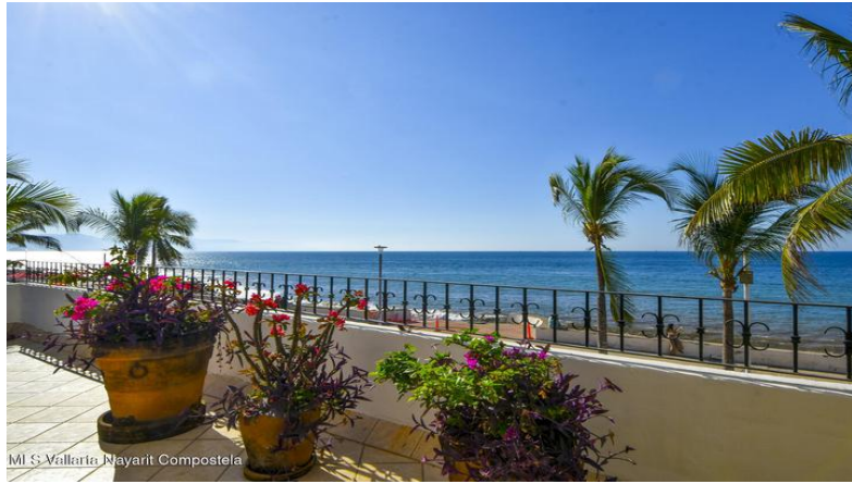
MI S Vallarta Nayarit Compostela