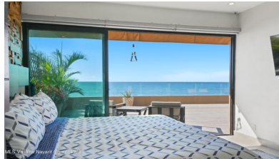
MLS Vallarta Nayarit