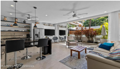
MES Vallarta Nayarit Compostela