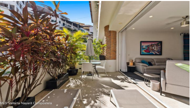
MES Vallarta Nayarit Compostela