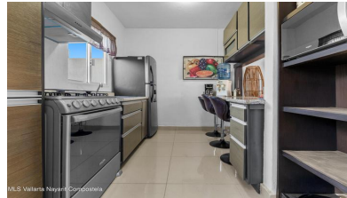
MLS Vallarta Navarri Compostela