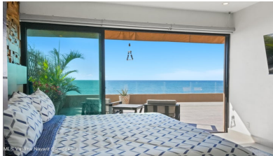
MLS Vallarta Nayarit