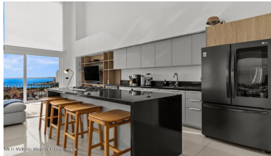
MLS Vallarta Nayarit Compoctela