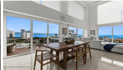
MLS Vallarta Nayarit Compoctela