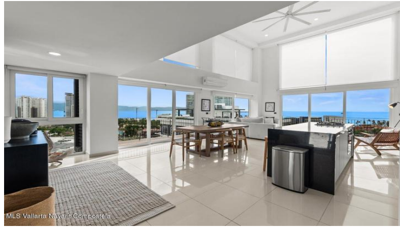
MLS Vallarta Nayarit Compoctela