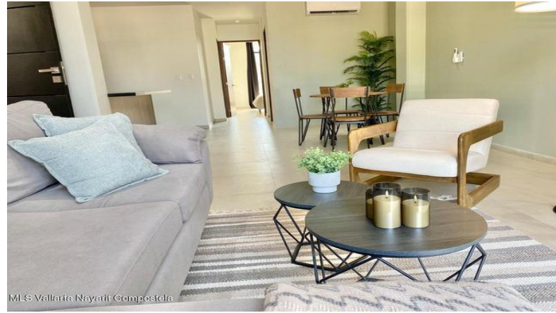
MIS Vallarta Nayarit Compostela