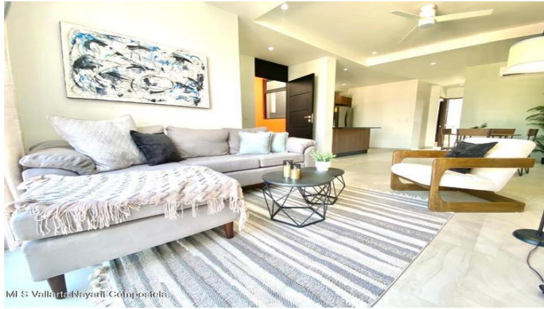
MIS Vallarta Nayarit Compostela