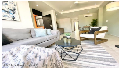
MIS Vallarta Nayarit Compostela