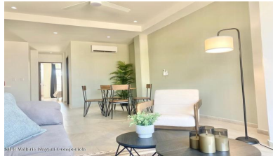
MIS Vallarta Nayarit Compostela