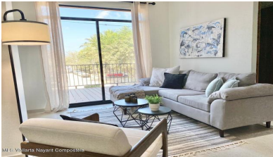
MIS Vallarta Nayarit Compostela