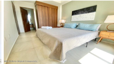
MIS Vallarta Nayarit Compostela