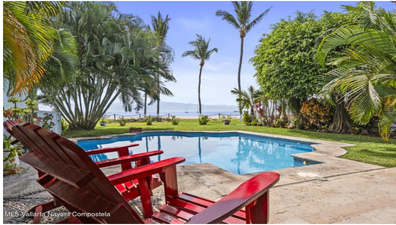
MLS Vallarta Navarri Compostela