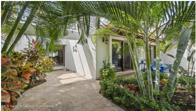
MLS Vallarta Navarri Compostela