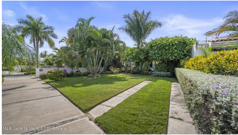
MLS Vallarta Navarri Compostela