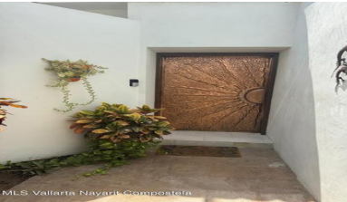
MLS Vallarta Navarri Compostela