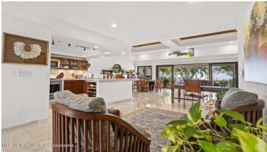
MLS Vallarta Navarri Compostela