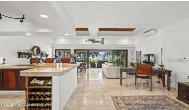
MLS Vallarta Navarri Compostela