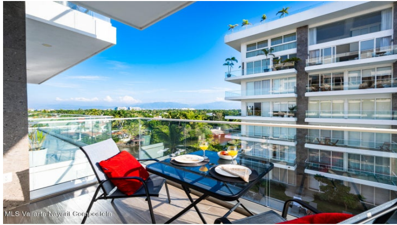
MLS Vallarta Nayarit Compoelca