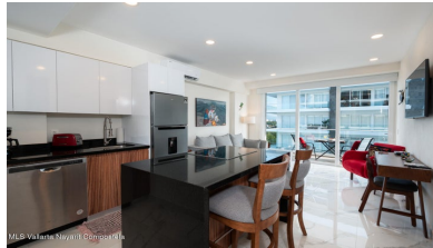
MLS Vallarta Nayarit Compoelca