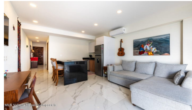
MLS Vallarta Nayarit Compoelca