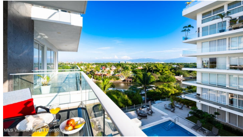
MLS Vallarta Nayarit Compoelca