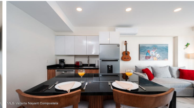
MLS Vallarta Nayarit Compoelca