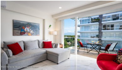
MLS Vallarta Nayarit Compoelca