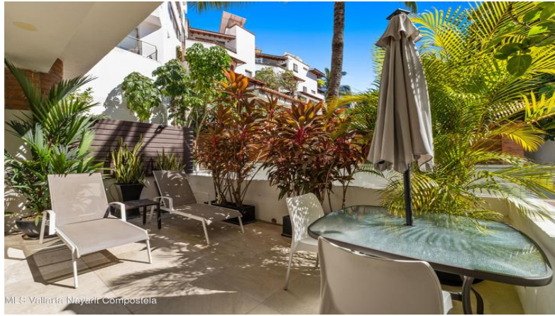
MES Vallarta Nayarit Compostela