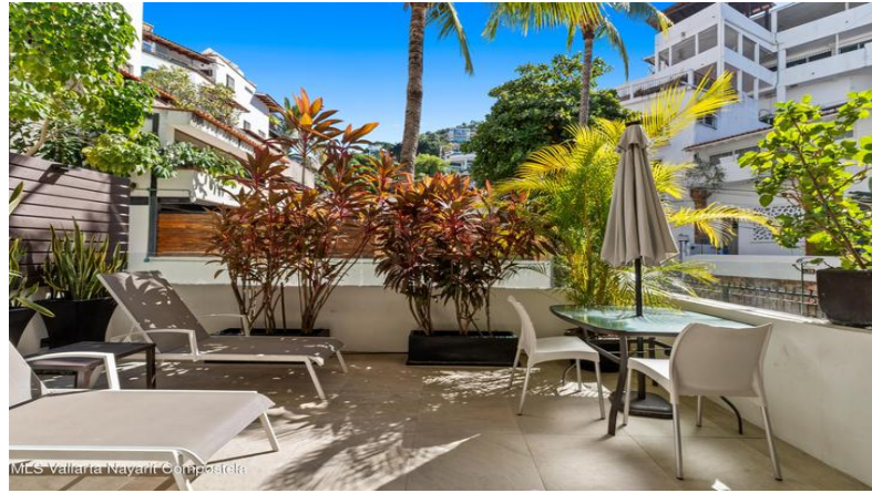
MES Vallarta Nayarit Compostela