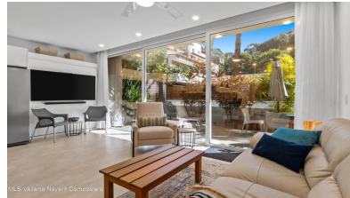
MES Vallarta Nayarit Compostela