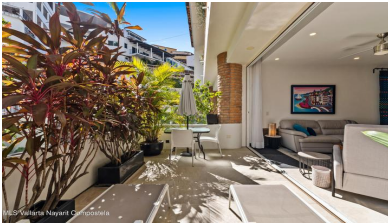
MES Vallarta Nayarit Compostela