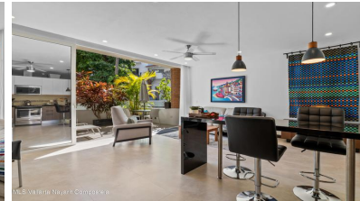
MES Vallarta Nayarit Compostela