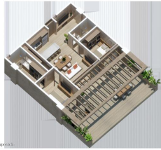
MI S Vallarta Nayarit Compositela