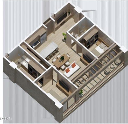
MI S Vallarta Nayarit Compositela