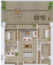
MI S Vallarta Nayarit Compositela