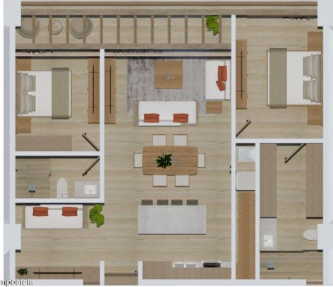
MI S Vallarta Nayarit Compositela