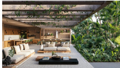
MI S Vallarta Nayarit Compositela